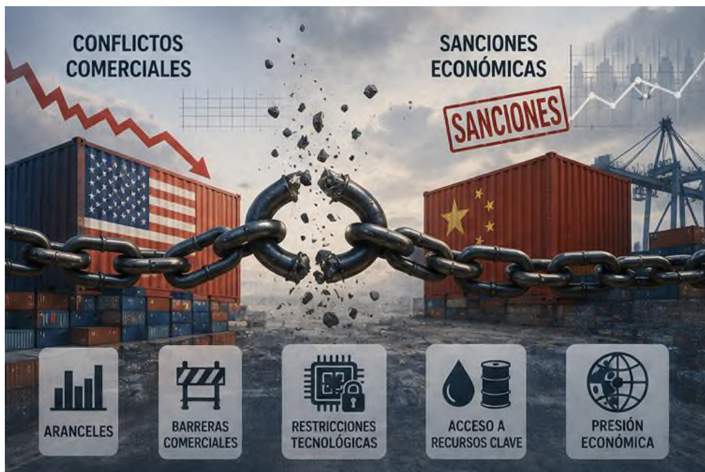
Figura 2.3 Tipología de disputas comerciales, sanciones y medidas de coerción económica.