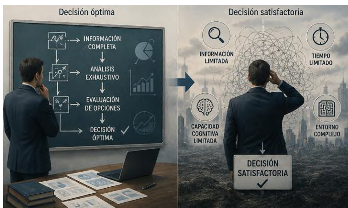
Figura 3.1 Enfoque Racional y Realidad Acotada

Los enfoques de la racionalidad perfecta y la racionalidad limitada no han de ser vistos como visiones opuestas, más bien como abordajes que se apoyan mutuamente. Si bien el paradigma racional suministra un constructo ideal de cómo debieran ser los procesos decisorios en situaciones hipotéticas, la racionalidad acotada, en cambio, describe de manera más veraz las conductas de personas y entidades. Integrar ambos marcos de entendimiento posibilita un examen más profundo de los mecanismos decisorios que operan en la arena política global, en la esfera económica mundial y en la definición de planes en contextos plagados de una considerable complejidad e imprevisibilidad.