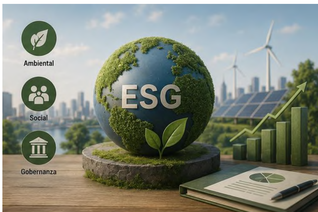
Figura 7.3 Finanzas sostenibles y estándares ESG

Finanzas sostenibles y los estándares ESG plantean una lógica renovada en la operativa del sistema financiero mundial. Integra rentabilidad, sostenibilidad, responsabilidad social con criterios de apoyo. En el marco del actual sistema global, esta dirección promete ser componente esencial para erigir un esquema económico planetario equitativo, robusto y abocado a progreso duradero.