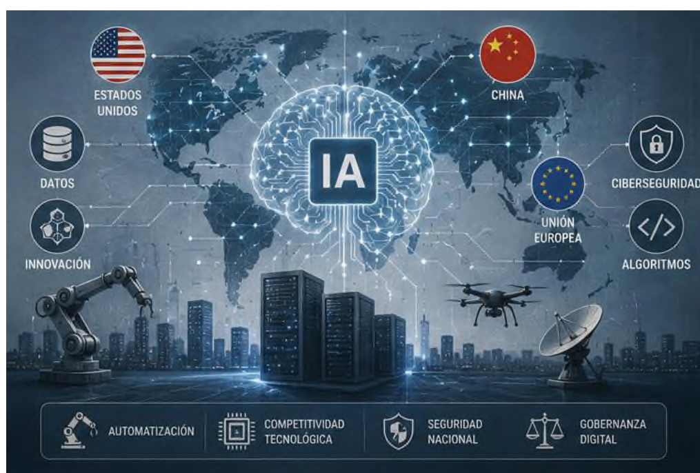
Figura 5.1 Cambio climático: Impacto ambiental y seguridad alimentaria global.

El lado geopolítico de la inteligencia artificial demuestra cómo la tecnología transita a ser un pilar preponderante de potencia en la arquitectura internacional actual. La vanguardia en indagación, la innovación y la implementación de esquemas inteligentes impactan de lleno la solvencia económica, la salvaguardia nacional y la facultad de preponderancia planetaria de los estados. En un panorama marcado por el galopante viraje tecnológico y el auge de la inteligencia artificial, se erige como uno de los pilares esenciales que definirán el reparto de la hegemonía mundial en el porvenir próximo.