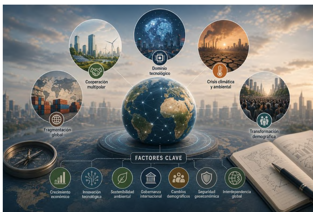
Figura 8.3 Escenarios globales futuros

Siguiendo esto, la construcción de predicciones mundiales a futuro facilita la comprensión de la transformación constante del orden internacional. La mezcla de cosas económicas, tecnológicas, ambientales y políticas crea muchas rutas posibles, forzando a los países y colectivos a desarrollar habilidades de ajuste, resiliencia y visión táctica para enfrentar un mundo cambiante y bastante incierto.