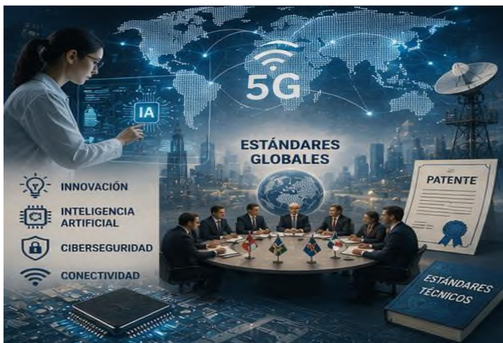
Figura 5.2 El agua como recurso estratégico: Escasez y tensiones internacionales.

directa en la rivalidad económica, la independencia estratégica y el sitio que ocupan los colectivos en el entramado mundial. En un cuadro marcado por vertiginosos cambios digitales, estas variables seguirán siendo determinantes en la estructuración del influjo a escala global durante los años venideros.