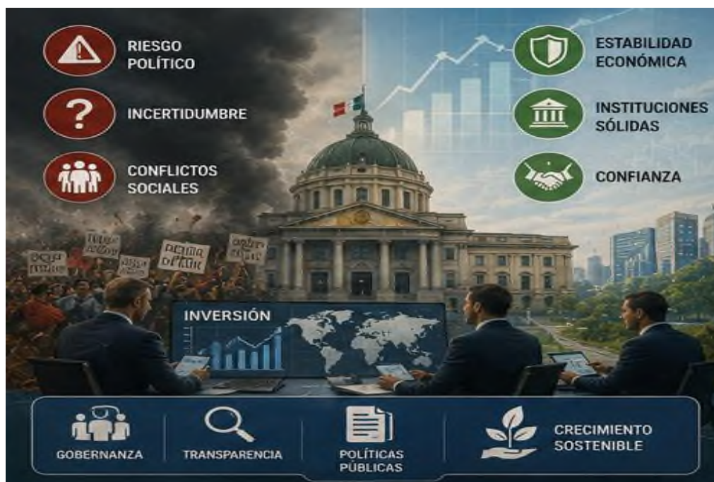
Figura 6.3 Seguridad económica internacional: Vulnerabilidades y escenarios futuros de los recursos.

desarrollo esenciales y la mejora de la administración pública son puntos clave para reducir el desequilibrio y sentar mejores bases para que el progreso perdure. Ante el escenario global de la economía y las regiones que empieza a mostrarse, reducir las flaquezas de la política será algo que contará mucho para que América Latina pueda competir mejor e integrarse de forma más amplia al mundo.