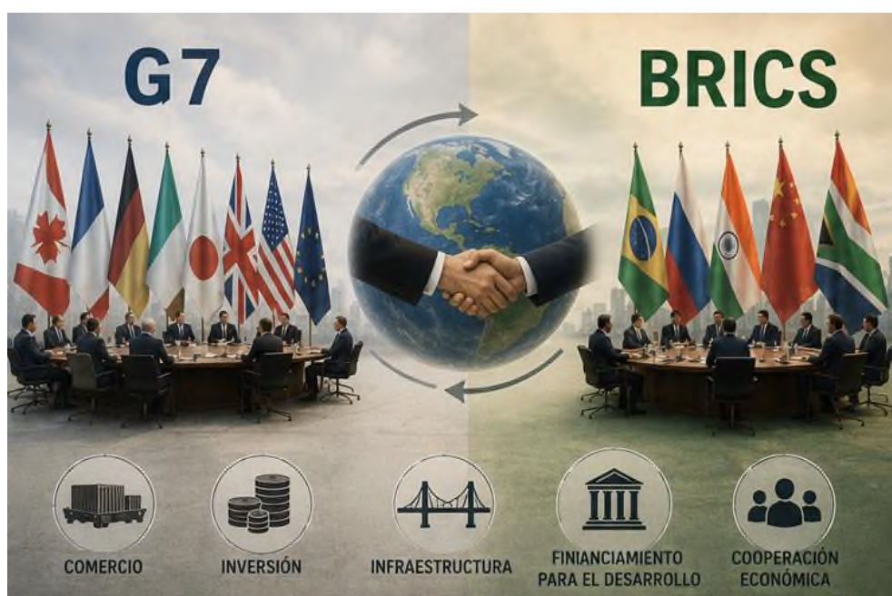
Figura 2.2 Reconfiguración de alianzas globales: Contraste estratégico entre el G7 y los BRICS.

El panorama de las alianzas económicas ha visto una metamorfosis considerable en las últimas décadas, un indicador de que la distribución del poder global también está experimentando mutaciones. Economías que antes no figuraban mucho ahora tienen peso propio, existen más formas de cooperación entre países y cada vez ganan terreno actores que antes apenas asomaban. Todo esto ha ido dando vueltas a la organización económica internacional. Así, cuando el G7 interactúa con los BRICS, lo que se ve es cómo en este mundo multipolar de hoy la influencia económica deja de concentrarse en unos pocos y se reparte entre varios centros de decisión.