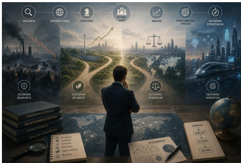
Figura 3.3 Prospectiva y Construcción de Escenarios Estratégicos

tecnológico y geopolítico hoy en día, la prospectiva se ha vuelto una herramienta que no puede faltar para prever cambios, crear planes que se adaptan y estar más listos para los retos globales.