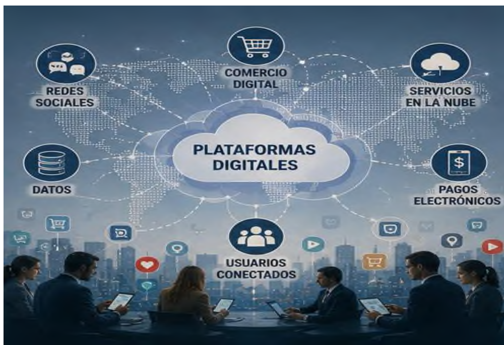
Figura 5.3 Geopolítica marítima: Rutas comerciales estratégicas y recursos oceánicos.

económico cada vez más digitalizado, las plataformas de las que hablamos desempeñarán sin duda una función decisiva. Su influencia se notará al dar forma a los procesos económicos y geopolíticos. Ellas definirán en última instancia el porvenir del sistema internacional.