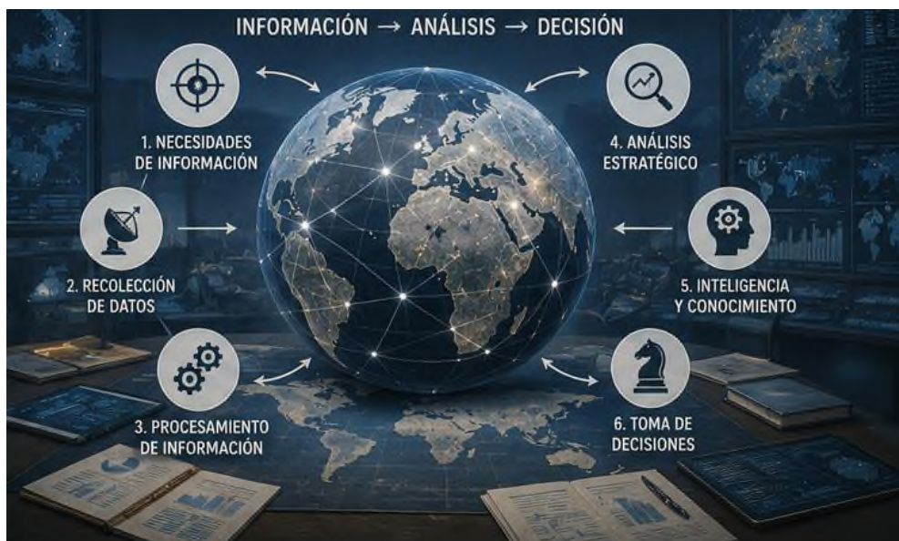
Figura 3.2 Inteligencia Estratégica

panorama internacional marcado por una alta dosis de imprevisibilidad y mutación continua.