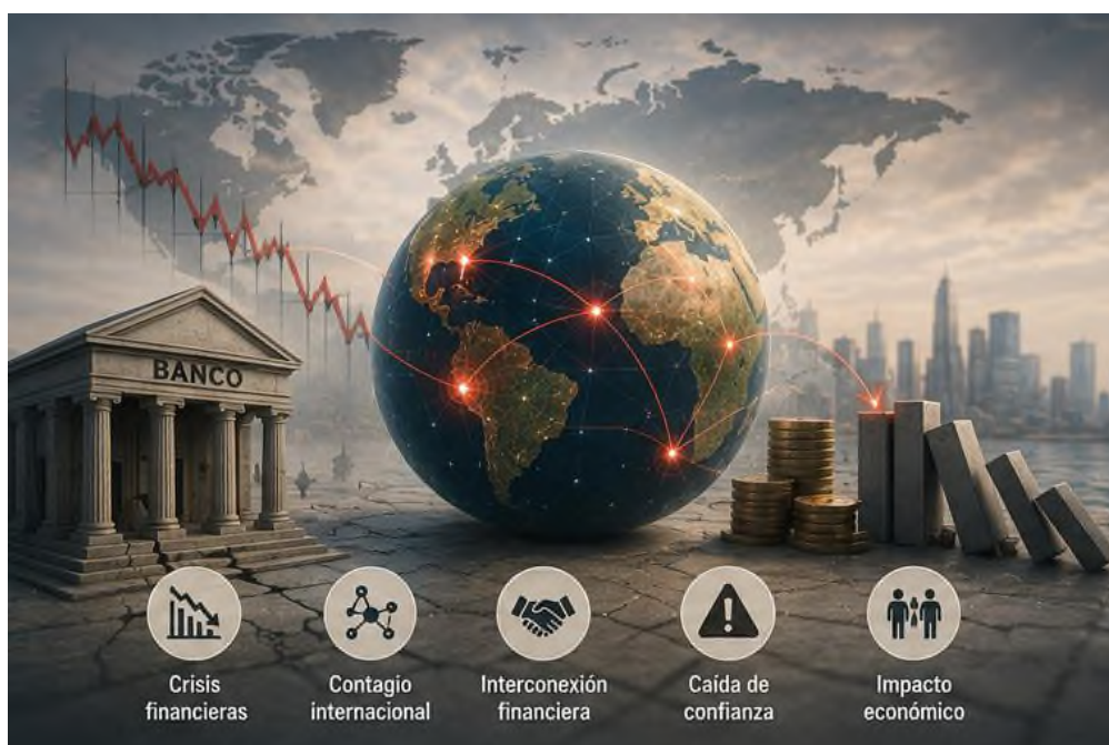
Figura 7.2 Efectos de contagio internacional

Crisis financieras y sus efectos a escala global evidencian la complejidad y la profunda interconexión que caracterizan a la economía planetaria actual. La interconexión de los mercados de capitales, aunque esto otorga notables ventajas en el acceso a financiación y a la diversificación de inversiones, concurrentemente propicia susceptibilidades, las cuales pueden magnificar las repercusiones de desaceleraciones económicas. La aptitud de las naciones para robustecer sus marcos institucionales, perfeccionar sus directrices regulatorias y armonizar las estrategias globales será un pilar para mitigar los peligros y salvaguardar la solidez económica en un contexto planetario crecientemente interdependiente.