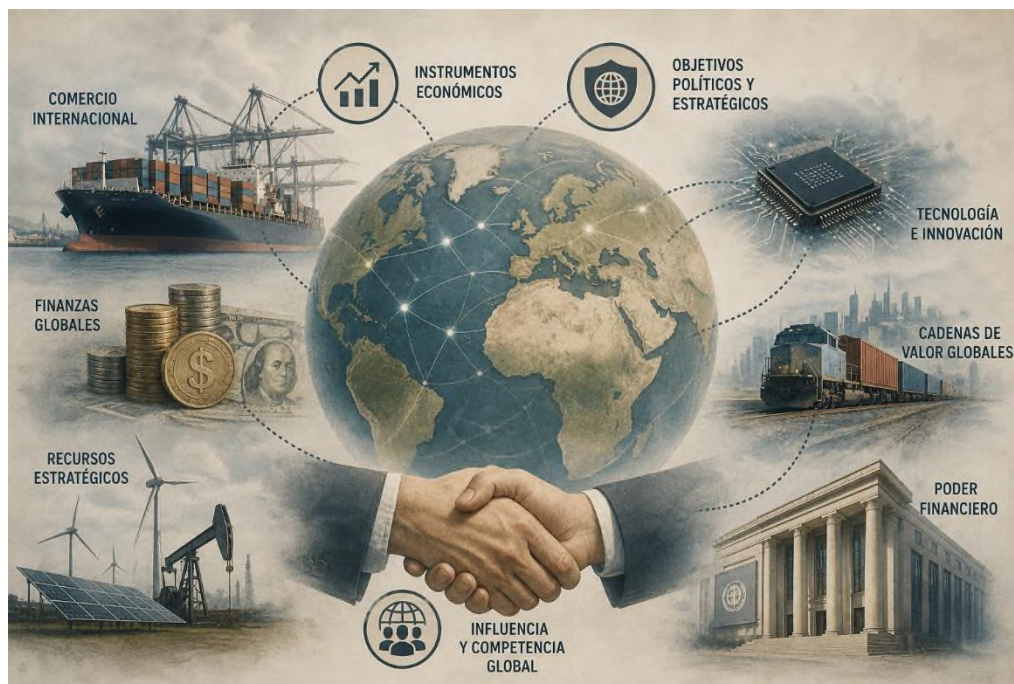
Figura 1.2 Perspectivas, dimensiones y herramientas de análisis de la geoconomía contemporánea.