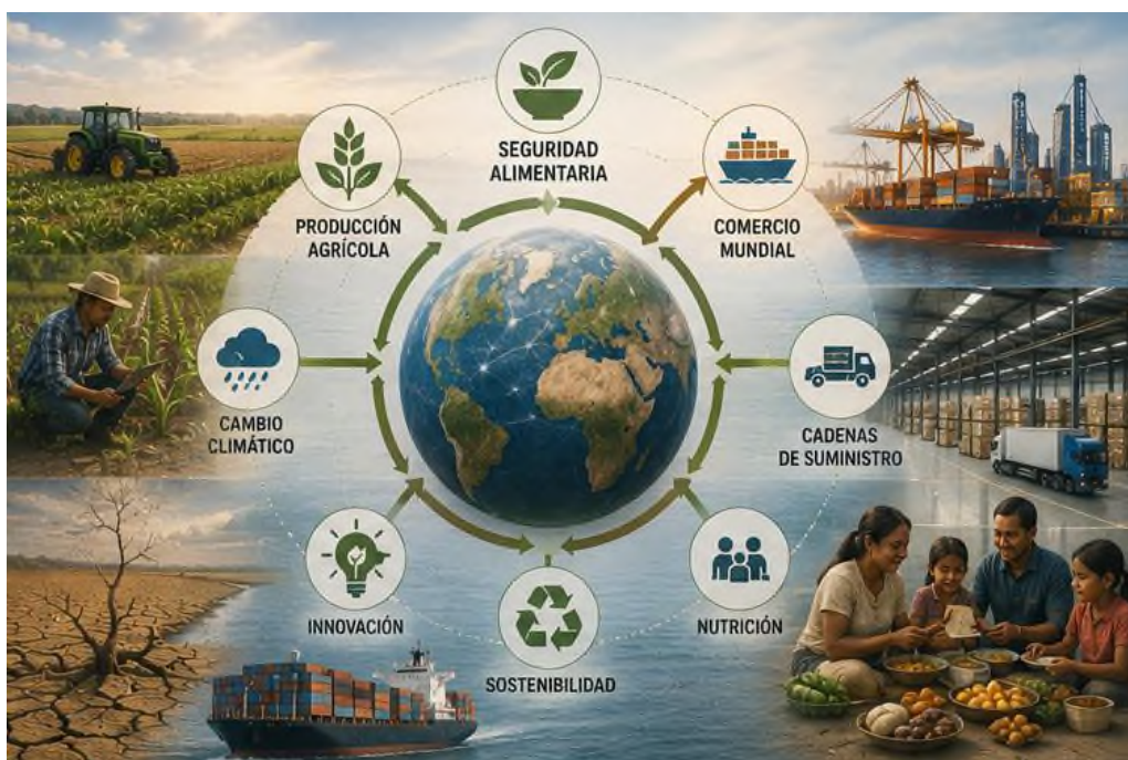
Figura 4.2 Desafíos, variables y sostenibilidad de la seguridad alimentaria internacional.