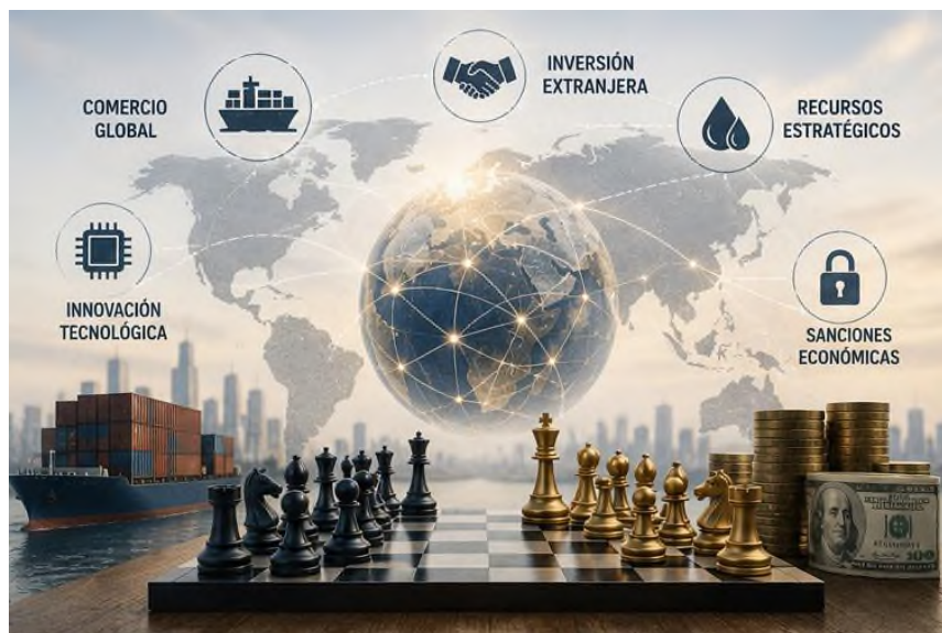
Figura 1.3 Mecanismos e instrumentos de la economía como factor de poder estratégico internacional.