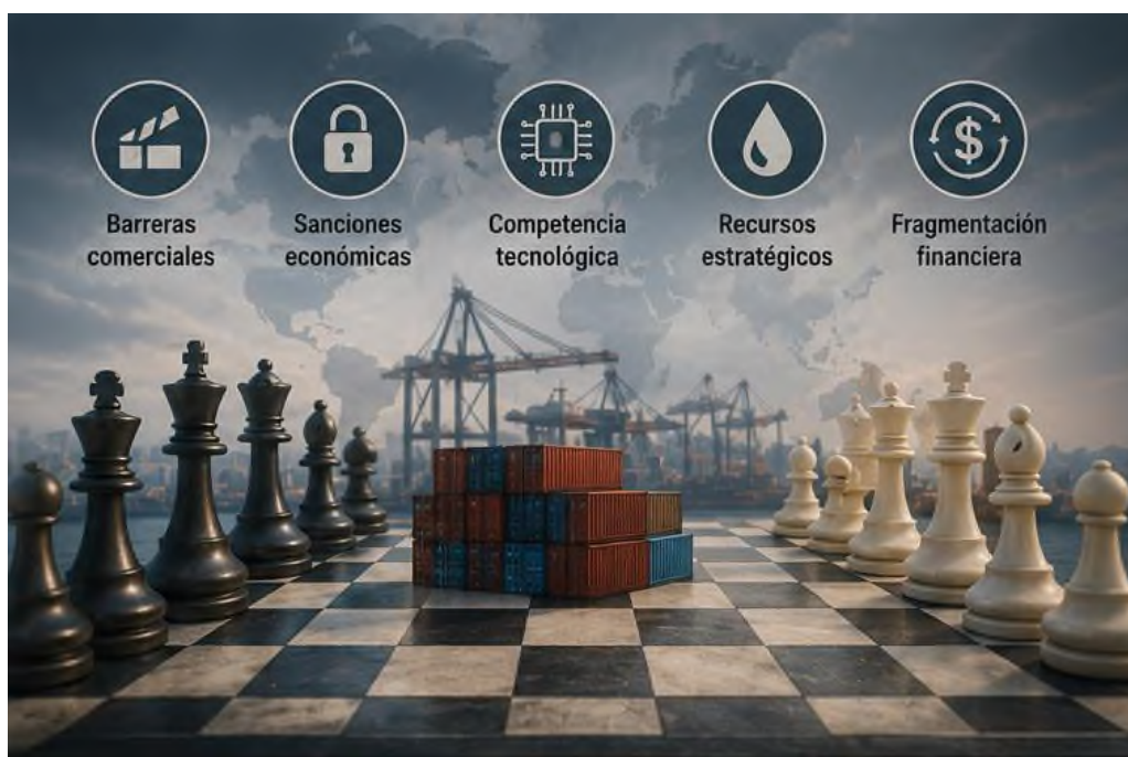
Figura 8.2 Conflictos económicos y geoeconómicos

Los recientes conflictos económicos y geoeconómicos dan fe de una mutación profunda en la estructura del orden global. El enfrentamiento entre naciones se manifiesta actualmente de manera más asidua mediante canales económicos y tecnológicos. En este escenario, la interdependencia global coexiste con la rivalidad estratégica, generando un entorno complejo que redefine las bases del poder y la cooperación internacional.