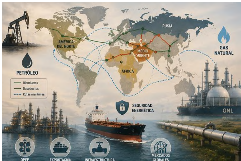
Figura 4.1 Factores clave de la geopolítica de los hidrocarburos y la seguridad energética global.