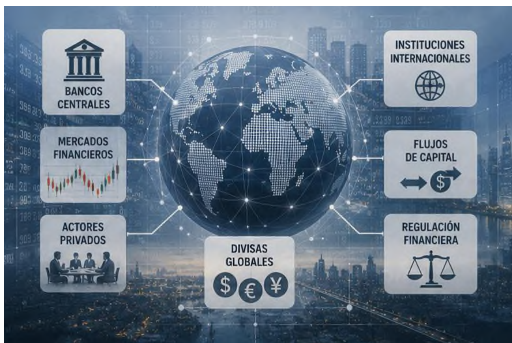
Figura 2.1 Estructura, actores y flujos de capital en el sistema financiero global.