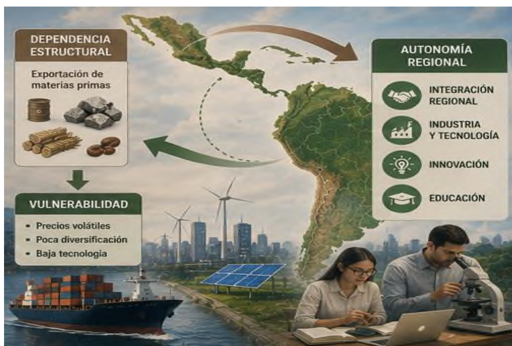
Figura 6.1 Tecnologías limpias: Soberanía tecnológica y sostenibilidad industrial.

La conexión entre el estar atado a estructuras, el desarrollo y la autonomía de las regiones sigue siendo uno de los puntos más importantes para entender la intervención internacional de Latinoamérica. Si bien la región ha dado pasos importantes en ámbitos económicos y sociales, todavía hay desafíos relacionados con diversificar lo que produce, usar la tecnología de forma más nueva y hacer más sólidas las instituciones. Su pericia al confrontar estas vicisitudes influirá tremendamente en las ocasiones para forjar estructuras de avance sostenibles, pujantes y autónomas en el panorama geoeconómico mundial.