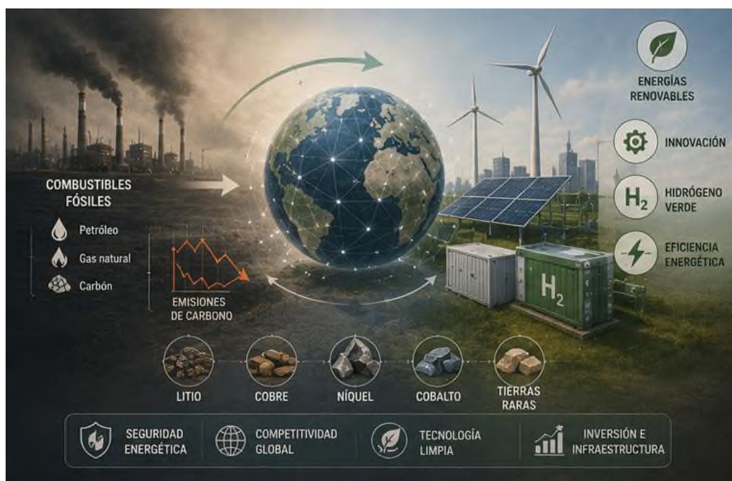
Figura 4.3 Transición energética global: Energías renovables y seguridad económica.