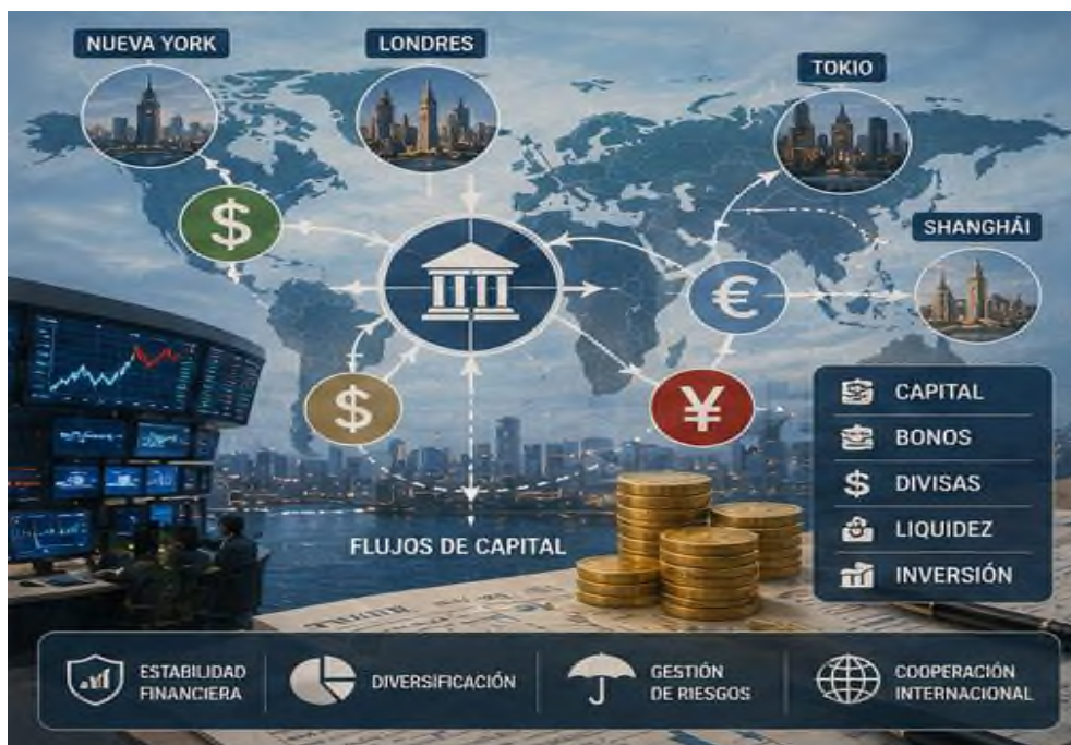
Figura 7.1 Vínculo entre los dominios financiero y geopolítico

Los mercados financieros internacionales abarcan mucho más que meros instrumentos de mediación económica. Su operativa está enraizada en dinámicas de poder, pugna geopolítica y tácticas de influencia internacional. El vínculo entre los dominios financiero y geopolítico continuará ejerciendo una función clave en el modelado del orden global contemporáneo, prediciendo los futuros de crecimiento, solidez y proyección de los países en un panorama planetario sumamente interrelacionado.