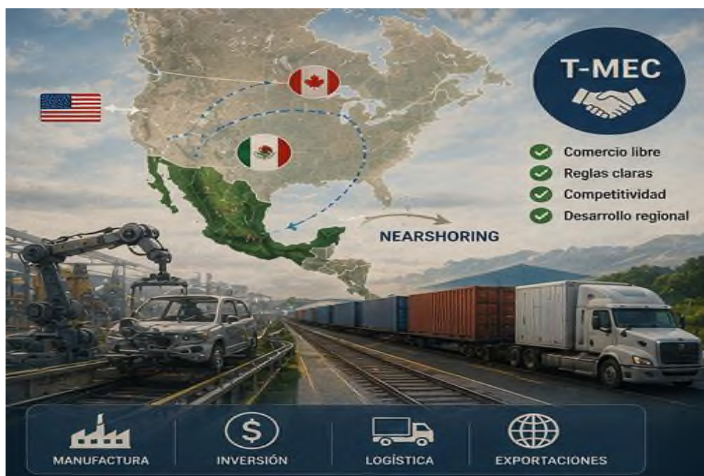
Figura 6.2 Gobernanza global: Acuerdos internacionales y regulación de recursos.